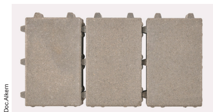
Le pavé Hydrojoint dans son nouveau format de 20 x 30 cm.

Mentionnons qu'Alkern densifie encore sa Gamme O' de réponses de pavés drainants avec l'arrivée d'un nouveau format pour l'Hydrojoint à écarteurs de 15 mm, désormais proposé en format de 20 x 30 cm. Une nouvelle référence qui, par sa souplesse décorative permet de créer des aménagements extérieurs durables et harmonieux.