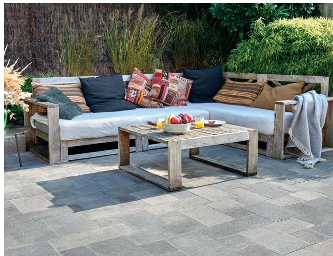
Pavés Newhedge classique multifformat coloris Grey.

À découvrir donc sur le stand Alkern à Paysalia 2025 : des produits drainants (Newhedge drainant, Linogreen et Hydrojoint) mais aussi des références bas carbone (pavé Hydrojoint Océan...)