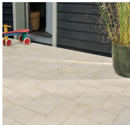
Le coloris Ivory du pavé Newhedge multifformat classique.

Soulignons qu'Alkern propose aussi une version multifformat du Newhedge dans sa forme classique disponible en trois coloris (Ivory, Grey et Coal) et disponible exclusivement sur la région Nord. Les atouts de cette nouvelle réponse Alkern résident dans leur modularité assurant une grande liberté de composition. En variant les dimensions sur un même aménagement, ils autorisent une grande flexibilité de pose pour le plus grand plaisir créatif des concepteurs, paysagistes et donneurs d'ordre des collectivités. Leur aspect visuel, évoquant des compositions plus naturelles et contemporaines, gagne ainsi en rythme comme en authenticité. Cassant la monotonie visuelle, ces solutions multifformats permettent enfin d'obtenir des alignements plus élégants.