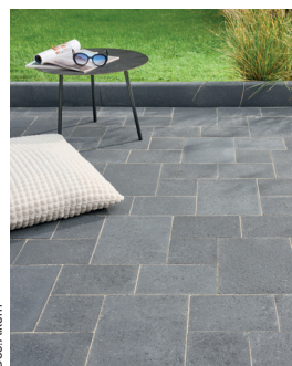
Pavé Newhedge classique multifformat coloris Coal.

Avec toujours cette version drainante de son pavé iconique, Alkern renforce encore ses réponses en vue de faciliter l'absorption rapide et efficace des eaux pluviales par infiltration dans le sol. Ces références, à la surface antidérapante sécurisant les déplacements et ne nécessitant que peu d'entretien, empêchent en effet la formation de flaques d'eau et réduisent fortement ruissellements et risques d'inondation. Précisons qu'Alkern a pourvu Newhedge drainant d'écarteurs de 5 mm facilitant la pose et conçus afin d'assurer l'infiltration des eaux pluviales avec un remplissage des joints en gravillons 1/3 mm ou 2/4 mm concassés et dépourvus de fines (lit de pose et un fond de forme drainants). Par ailleurs, ils revendiquent une durabilité élevée grâce à un hydrofuge de masse intégré dans leur process de fabrication.