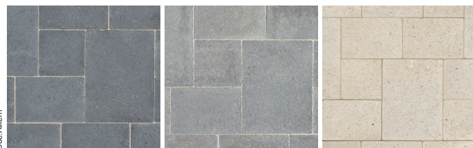
Les coloris du pavé multifformat Newhedge classique : Coal, Grey et Ivory.

Avec toujours cette version drainante de son pavé iconique, Alkern renforce encore ses réponses en vue de faciliter l'absorption rapide et efficace des eaux pluviales par infiltration dans le sol. Ces références, à la surface antidérapante sécurisant les déplacements et ne nécessitant que peu d'entretien, empêchent en effet la formation de flaques d'eau et réduisent fortement ruissellements et risques d'inondation. Précisons qu'Alkern a pourvu Newhedge drainant d'écarteurs de 5 mm facilitant la pose et conçus afin d'assurer l'infiltration des eaux pluviales avec un remplissage des joints en gravillons 1/3 mm ou 2/4 mm concassés et dépourvus de fines (lit de pose et un fond de forme drainants). Par ailleurs, ils revendiquent une durabilité élevée grâce à un hydrofuge de masse intégré dans leur process de fabrication.