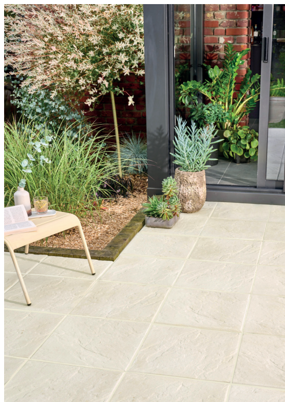
La dalle Rustique Re-source en coloris Sable.

Ainsi, Alkern annonce la disponibilité de sa dalle sur plots Re-Source, désormais produite à base de granulats de béton recyclés (GBR). Une référence qui réduit de facto l'impact carbone tout en favorisant l'économie circulaire. Dans la même logique, Alkern confirme l'arrivée d'un coloris sable de sa dalle Rustique Re-Source, référence emblématique de sa collection ; une teinte naturelle et chaleureuse qui complète idéalement une palette déjà très appréciée des concepteurs et paysagistes.